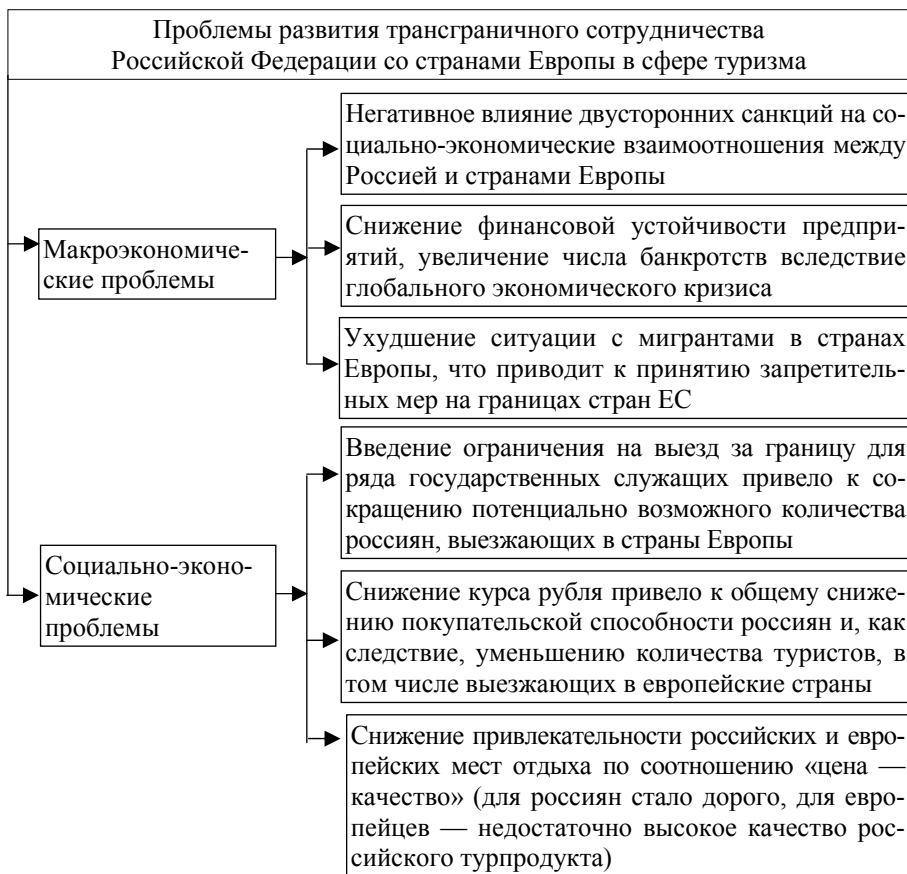
Рис. 4. Проблемы развития трансграничного сотрудничества Российской Федерации со странами Европы в сфере туризма

Безусловно, некоторые из этих проблем могут вызвать дискуссию. Например, в качестве проблемы развития трансграничного сотрудничества РФ и европейских государств в сфере туризма можно также назвать недостаток привлекательных региональных туристических продуктов, отсутствие их продвижения на внешних рынках и т. д. Авторы статьи объединили эти причины в последнем блоке рисунка 4: снижение привлекательности российских и европейских мест отдыха по соотношению «цена — качество». При этом учитывались особенности восприятия туристической услуги как комплексной (не только непосредственно услуги размещения, питания, транспортные, экскурсионные и другие, но и удовлетворенность от инфраструктуры мест отдыха в целом, отношения местного населения и т. д.). Поэтому под качеством обслуживания в рамках данной статьи понимается достаточно большое количество факторов, влияющих на общую оценку тура. Так, все большее значение стало придаваться фактору безопасности туристов. Для россиян страны Европы из-за увеличения количества мигрантов стали восприниматься как небезопасные, а для европейцев Россия в последние годы стала олицетворением военной державы.