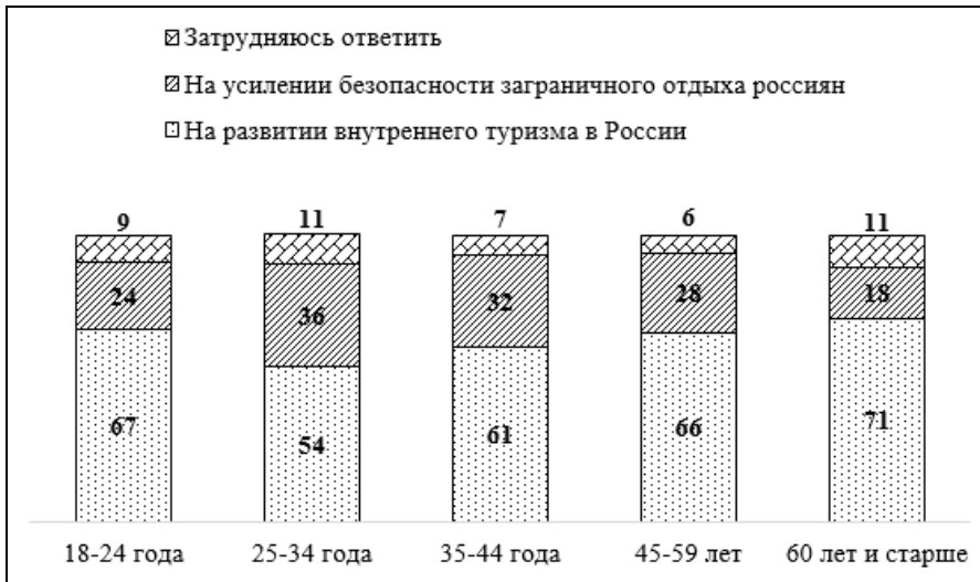
Рис. 3. Распределение ответов на вопрос: «На чем, по Вашему мнению, Правительству России сейчас следует сосредоточиться: на усилении безопасности заграничного отдыха россиян или на развитии внутреннего туризма в России?» (закрытый вопрос, один ответ, %)

Еще один недавний опрос ВЦИОМ показал, что значительная часть россиян наиболее важным направлением государственной политики в области туризма считает развитие внутреннего туризма, а не вопросы выездного туризма (рис. 3).